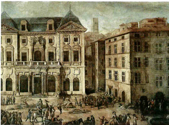
Tableau de Michel Serre représentant l'hôtel de ville de Marseille pendant la peste de 1720